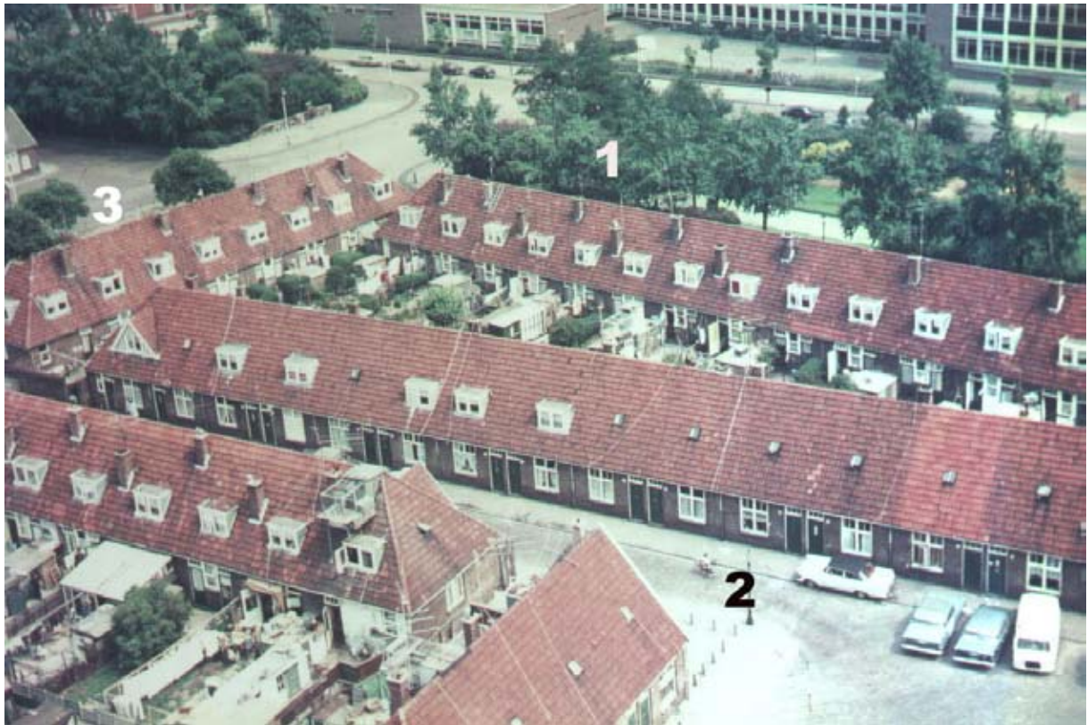
1 Laakweg, 2 Tak van Poortvlietstraat, 3 Tweede Calandstraat en 4 Stieltjesstraat, met hun rode pannedaken.