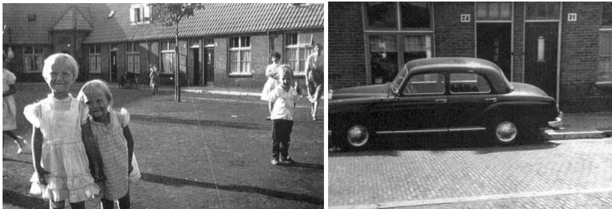
Het Laakhof, ik woonde op nr. 22

Op het plein, dat op een enkele na, geheel autoloos was, konden de kinderen zorgeloos tussen de bomen spelen.