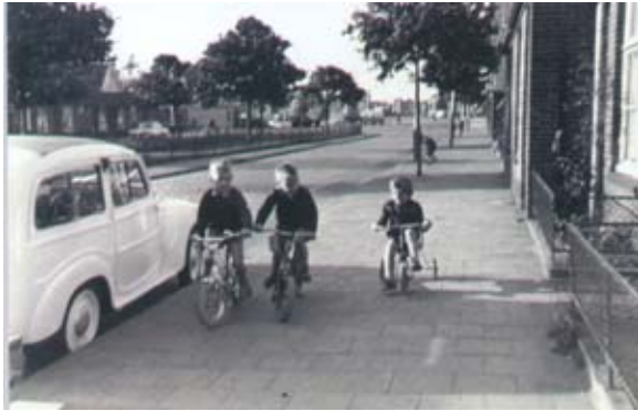
< Calandstraat gez. vanaf de hoek bij de Drogist naar de Calandbrug Voorheen waren er kleine portiekjes voor de winkels