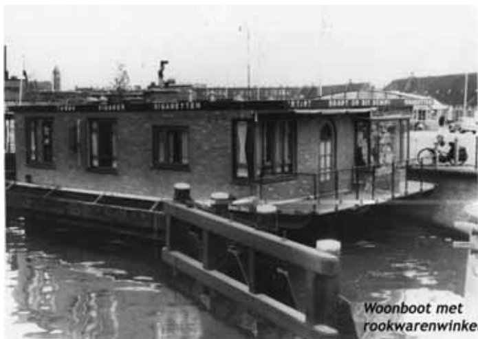
Woonboot met rookwarenwinkel

Verder de Slachthuislaan volgend in de richting van de Calandbrug, en de tweede ingang van het Laakhof passerend, kwam je uiteindelijk uit op de hoek van de Slachthuislaan en de Tweede Calandstraat. Ook hier waren op de hoeken winkeltjes, waarin respectievelijk een kantoor en “Het Wolhoekje” waren gevestigd